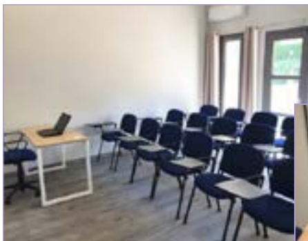
Salles de cours

→ Les formations sont dispensées toute l'année.